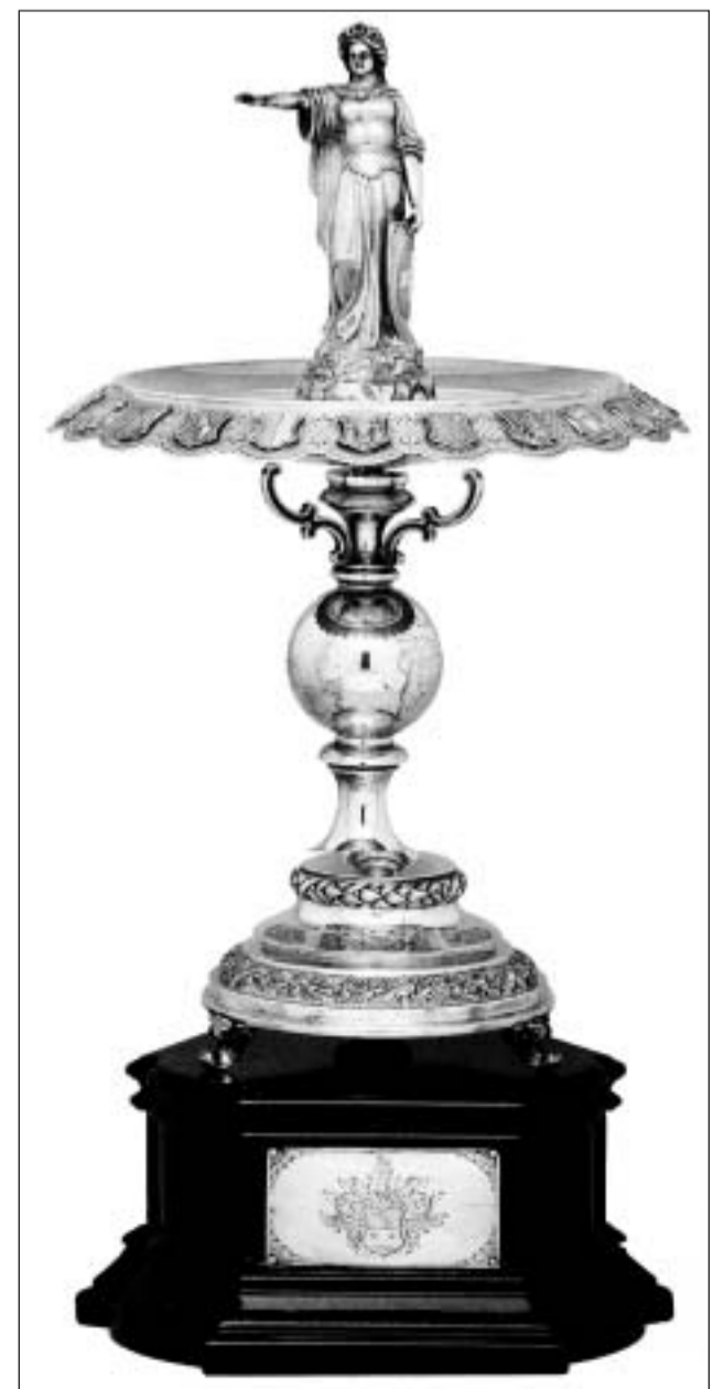
La Helvetia sco decoraziun da maisa – in regal per il cumissari general svizzer a l'exposiziun mundiala il 1873 a Vienna.