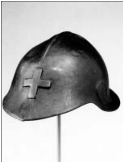
Chapellina d'enturn 1916.

il signuradi. Lez metta a disposiziun il chastè a Voltaire che resta là per in mez onn. Durant questa dimora decida Voltaire – disfamà en l'entira Europa – da sa chasar sper Geneva.