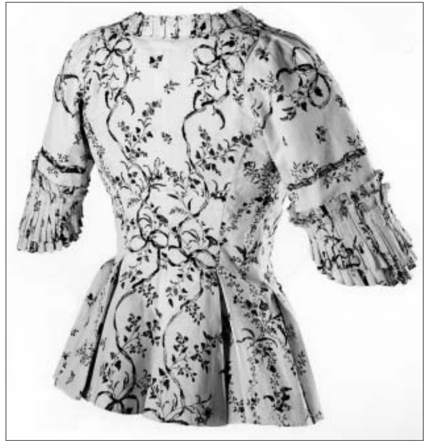
Giachetta da dunnas dal 1780 che raquinta l'istorgia da la produziun da textilas.