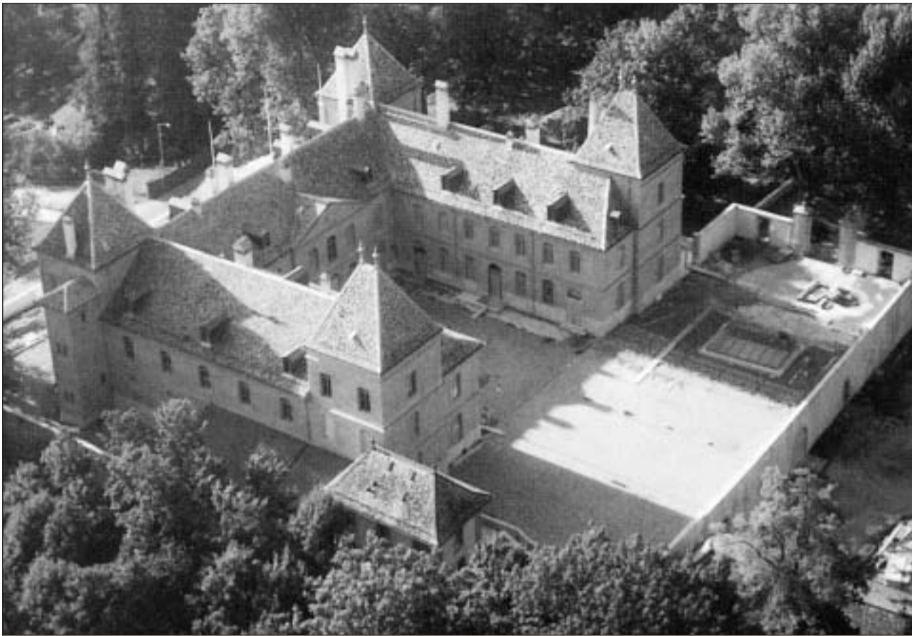
Il chastè da Prangins durant la renovaziun il 1995.